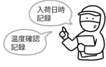
納入業者・食材の品質管理

子どもたちに安全な給食を提供するために、国のガイドラインに沿った衛生管理を行っています。各工程で、決められた内容を実施し、記録しながら作業を行うことで安全性を高めています。